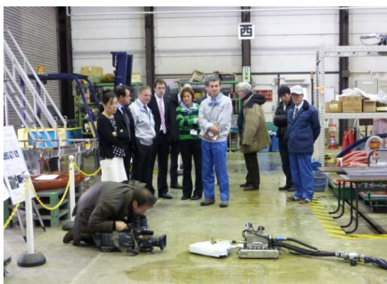
遠隔ジェット洗浄装置の開発状況の取材風景